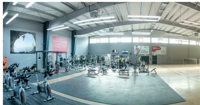
Im Magazin GQ rangiert der Sporttreff als bestes Studio in Rheinland-Pfalz