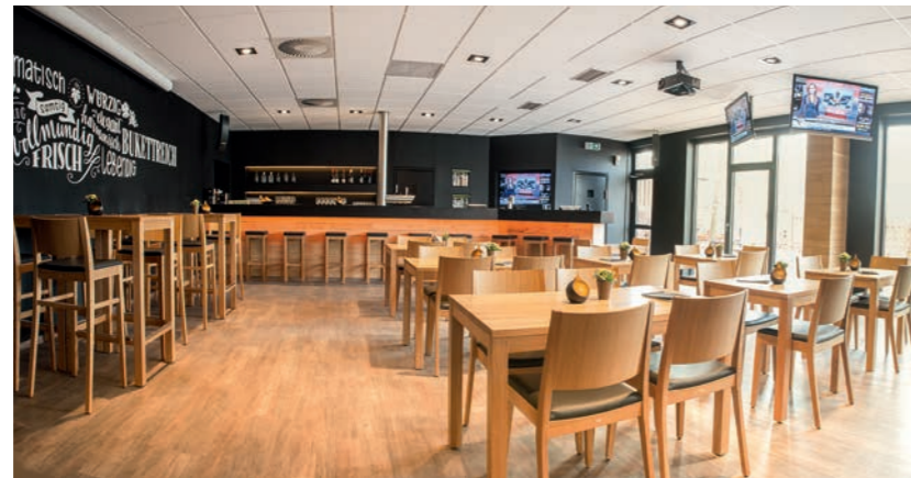
Sportschlounge mit exquisites Auswahl an rheinhessischen Weinen