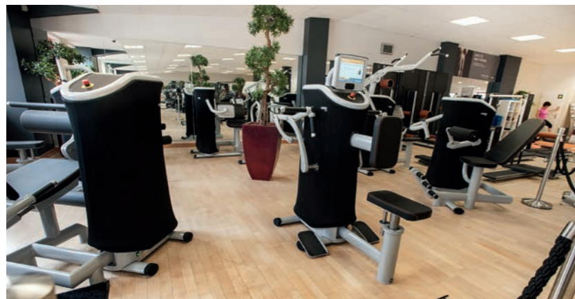
Hoher Spaßfaktor mit dem Zirkelkonzept »eGym«